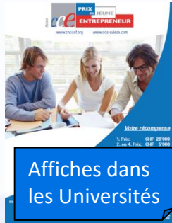
Affiches dans les Universités

Communication Interne (CCE, Universités, autorités françaises) Lancement du concours dans les Universités